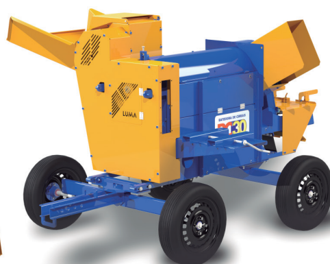
BC-30 TRACCIÓN ANIMAL