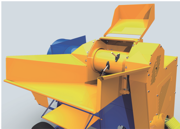
El alimentador automático garantiza la alimentación uniforme y continua.