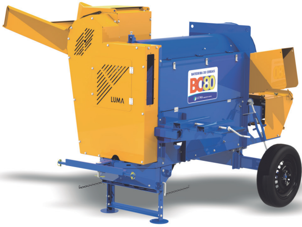
BC-80 BASADO DIÉSEL