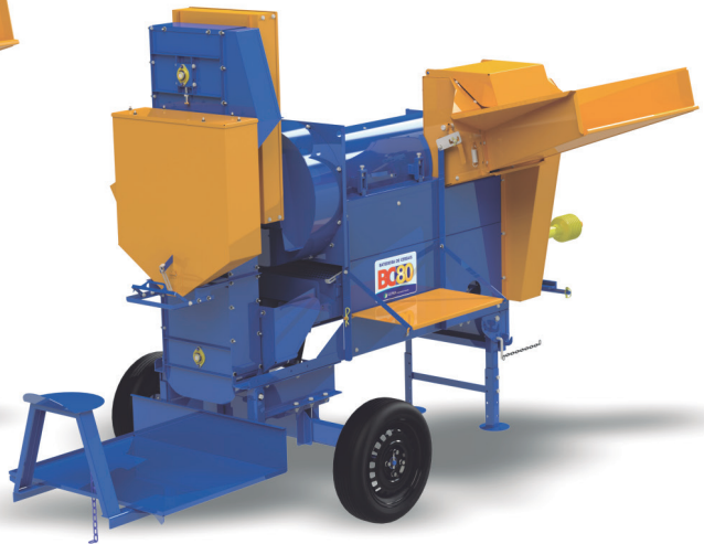
BC-80 PLATAFORMA Y ASCENSOR