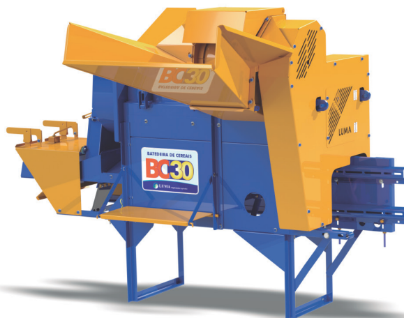
BC-30 CON ACCESORIO DE MOTOR