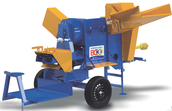
BC-30 CON PLATAFORMA