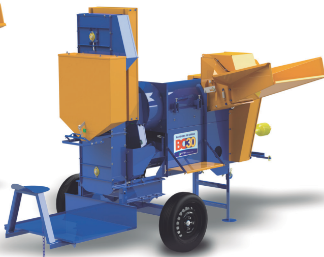
BC-30 CON PLATAFORMA Y ASCENSOR