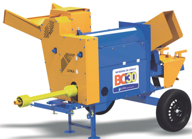
BC-30 CON EJE