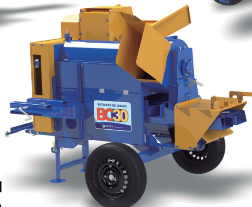
BC-30 RESIDENCIA EN DIESEL O GASOLINA