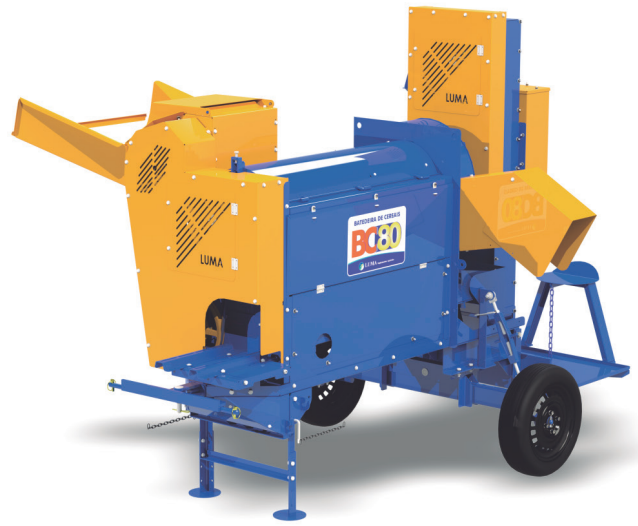
BC-80 BASE ELÉCTRICA Y ASCENSOR