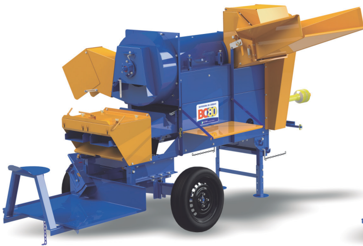
BC-80 PLATAFORMA ESTÁNDAR