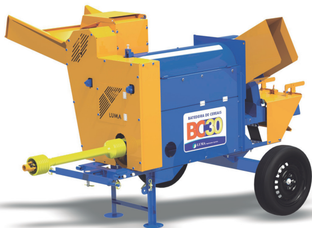
BC-30 COM EIXO