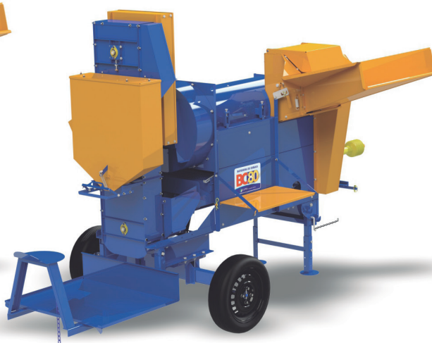
BC-80 COM PLATAFORMA E ELEVADOR