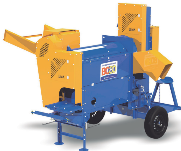
BC-80 COM BASE ELÉTRICA E ELEVADOR