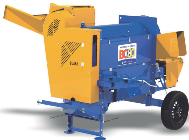
BC-80 COM BASE A DIESEL