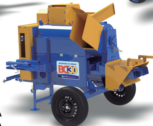
BC-30 COM BASE A DIESEL OU GASOLINA