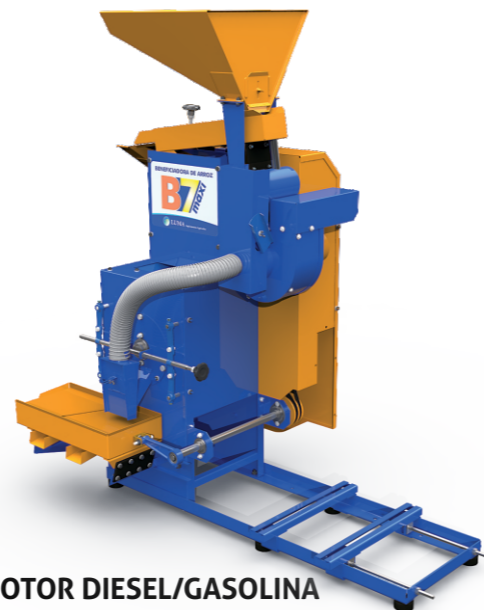
MOTOR DIESEL/GASOLINA DIESEL/PETROL ENGINES