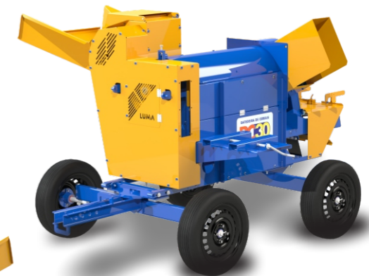
BC-30 TRACCIÓN ANIMAL