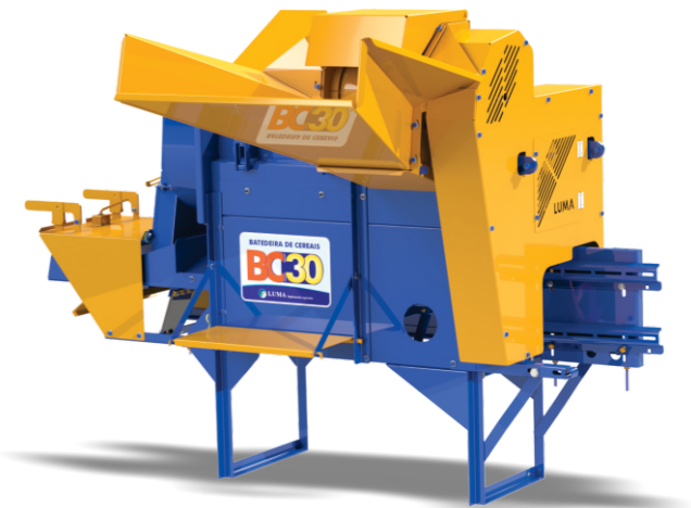
BC-30 CON ACCESORIO DE MOTOR

Las Trilladora de Cereales LUMA fueron desarrolladas para batir, agitar y embolsar cereales, tales como: maíz seco con paja y mazorca, frijol, soya, arroz y similares. Todas las versiones están equipadas con: