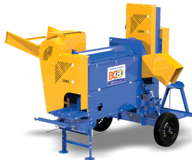
BC-80 BASE ELÉCTRICA Y ASCENSOR