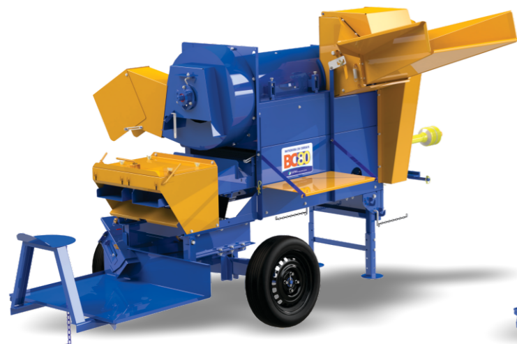
BC-80 PLATAFORMA ESTÁNDAR