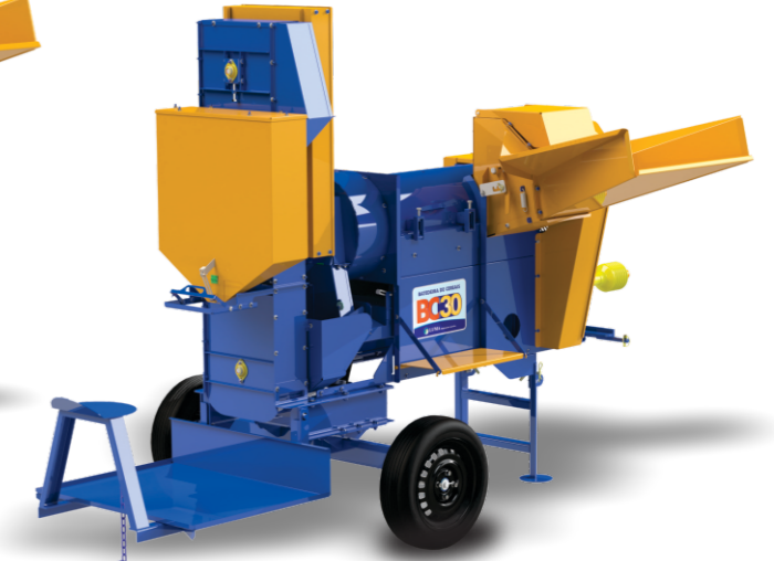
BC-30 CON PLATAFORMA Y ASCENSOR