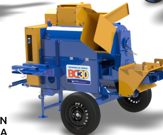
BC-30 RESIDENCIA EN DIESEL O GASOLINA