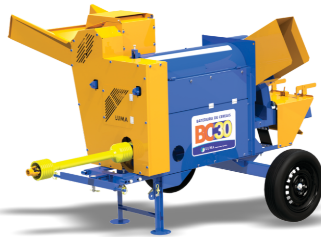
BC-30 CON EJE