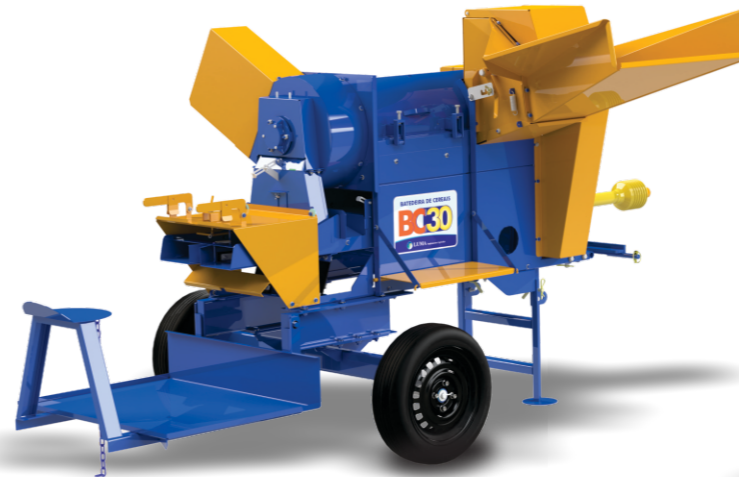
BC-30 CON PLATAFORMA

Potente rotor procesa el cereal sin dañar los granos.