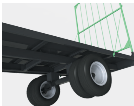
RUEDA TRASERA DOBLE